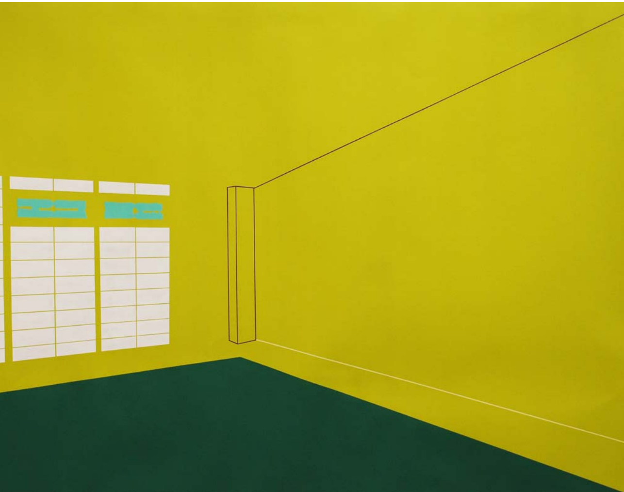
Tobira midori (panel verde) 2014 Acrílico sobre papel 102 x 152 cm.