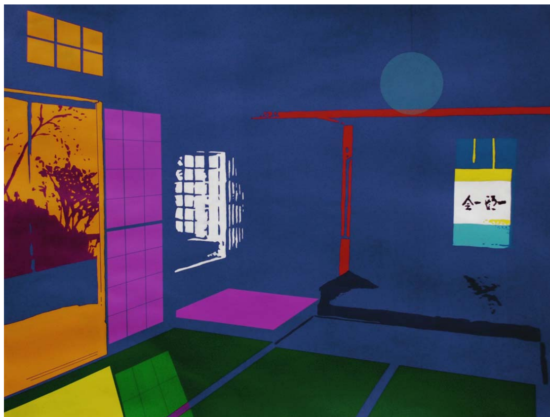
Toko no ma (habitación principal) 2014 Acrílico sobre papel 75 x 110 cm.