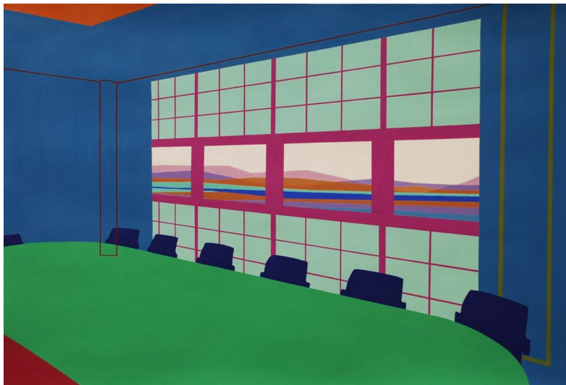
Têburu midori (mesa verde) 2014 Acrílico sobre papel 75 x 110 cm.