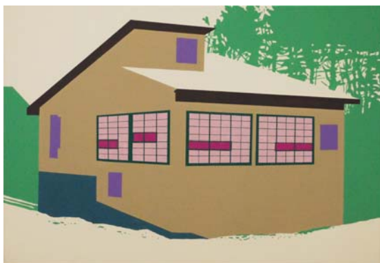
Uchi 2014 Acrílico sobre lienzo 38 x 55 cm.