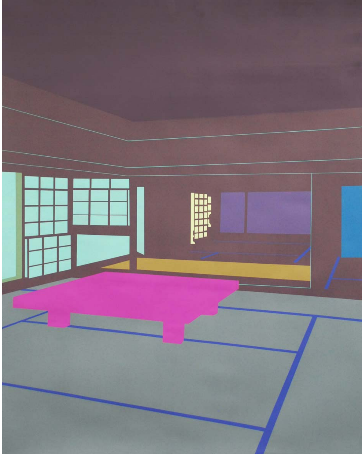
Têburu pinku (mesa rosa) 2014 Acrílico sobre papel 152 x 121 cm.