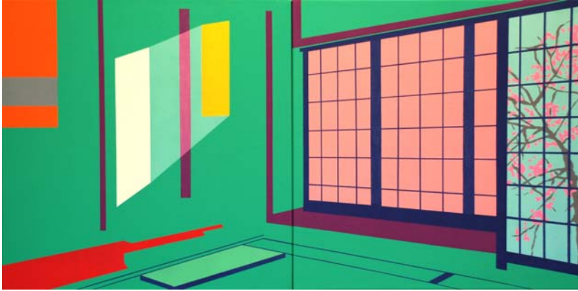
Uchi (casa) 2014 Acrílico sobre lienzo 2 x 40 x 40 cm.