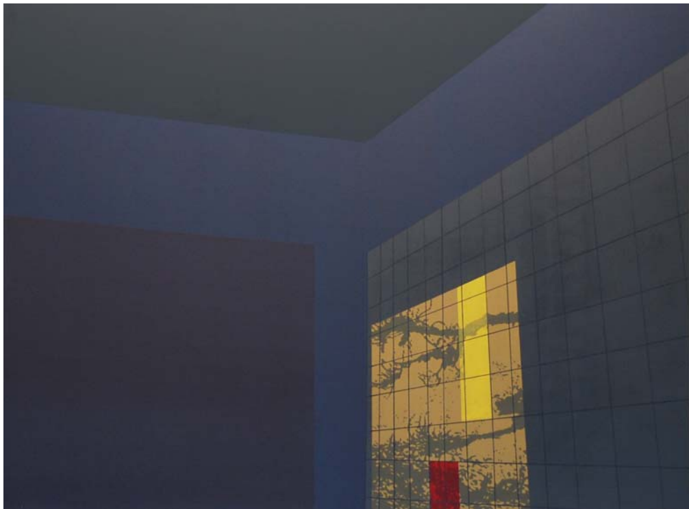
Mado (ventana) 2014 Acrílico sobre lienzo 73 x 100 cm.