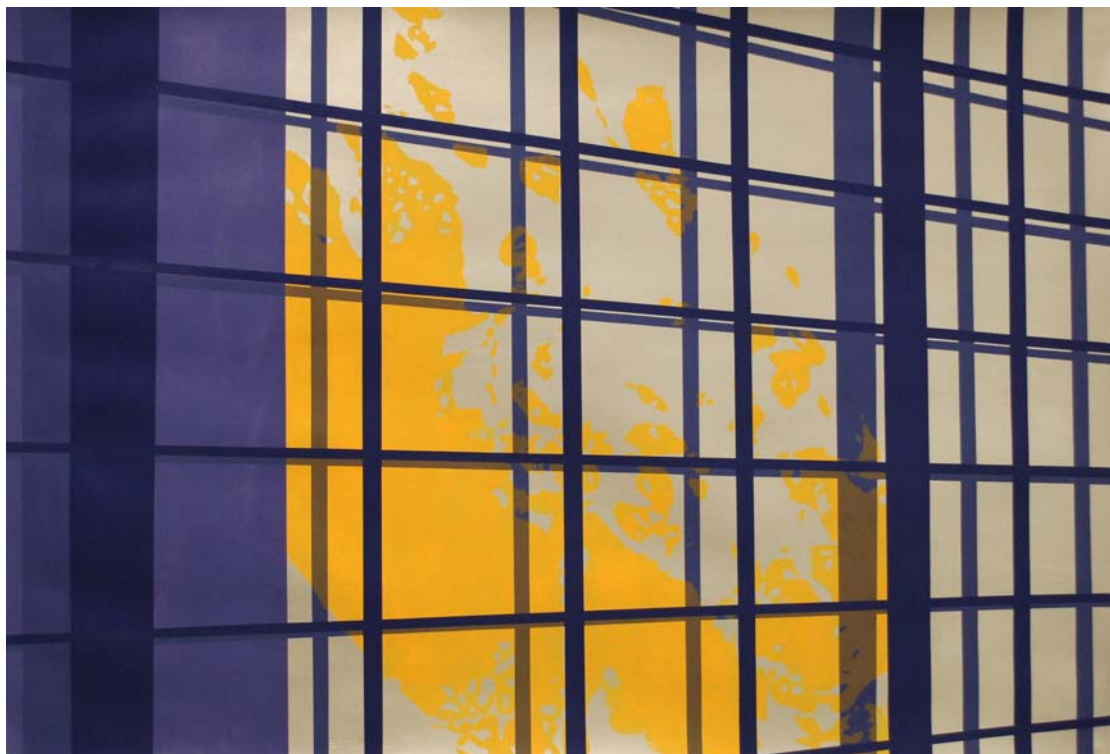
Shôji (panel de papel) 2014 Acrílico sobre papel 75 x 110 cm.