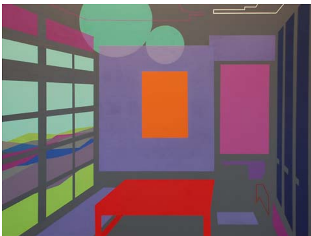
Têburu aka (mesa roja) 2014 Acrílico sobre lienzo 46 x 61 cm.