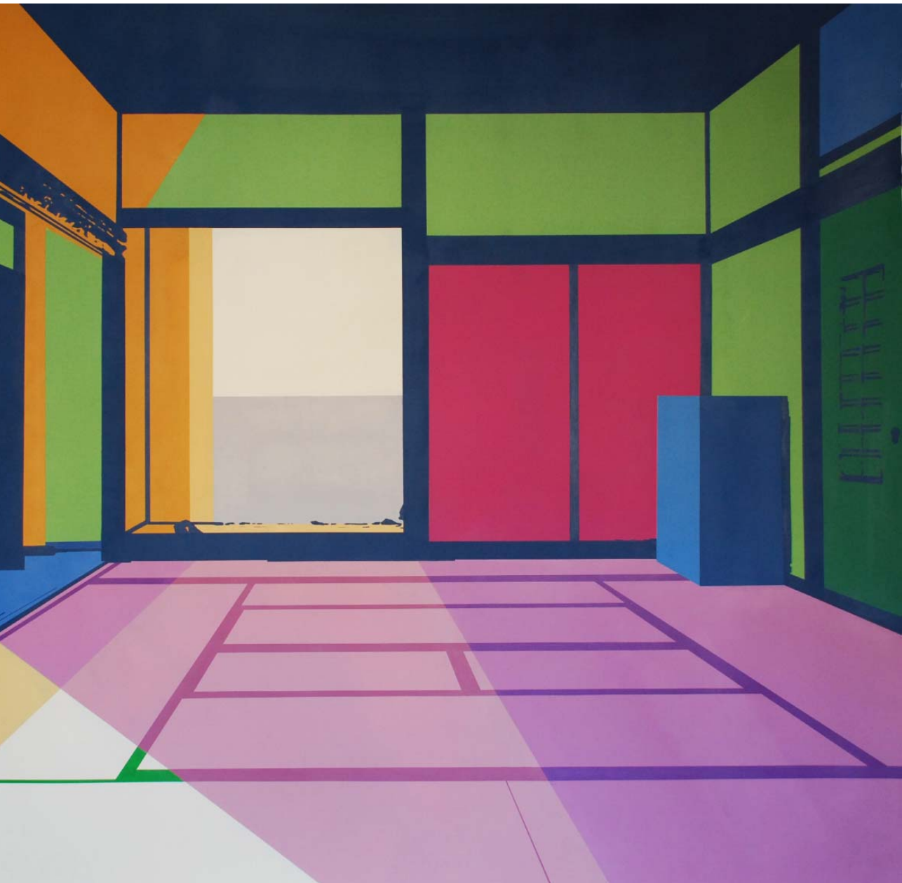
Ima (Sala de estar) 2014 Acrílico sobre papel 126 x 152 cm.