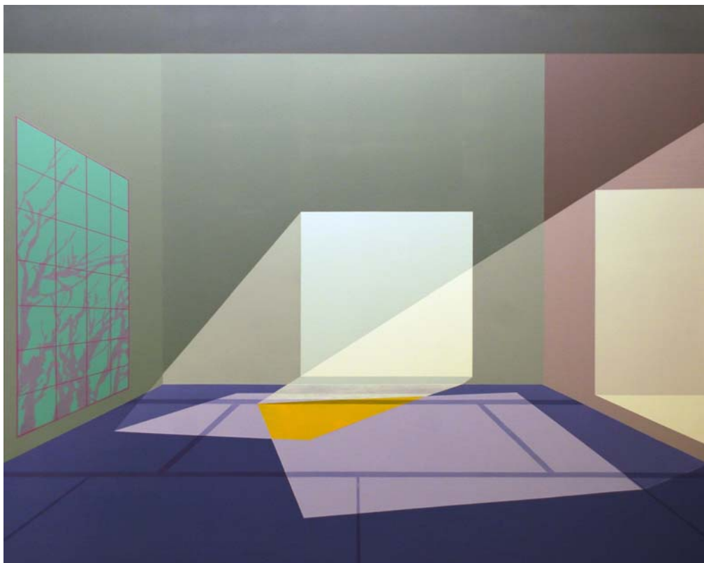
Yuugata (tarde) 2014 Acrílico sobre lienzo 81 x 100 cm.